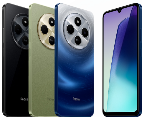
SMARTPHONE XIAOMI REDMI 14C REF.: SMP-266 / SMP-267 / SMP-288