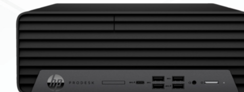
PC HP PRODESK 600 G6 REACONDICIONADO REF.: OC-0781