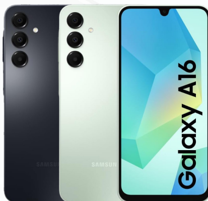
SMARTPHONE SAMSUNG GALAXY A16 REF.: SMP-297 / SMP-300