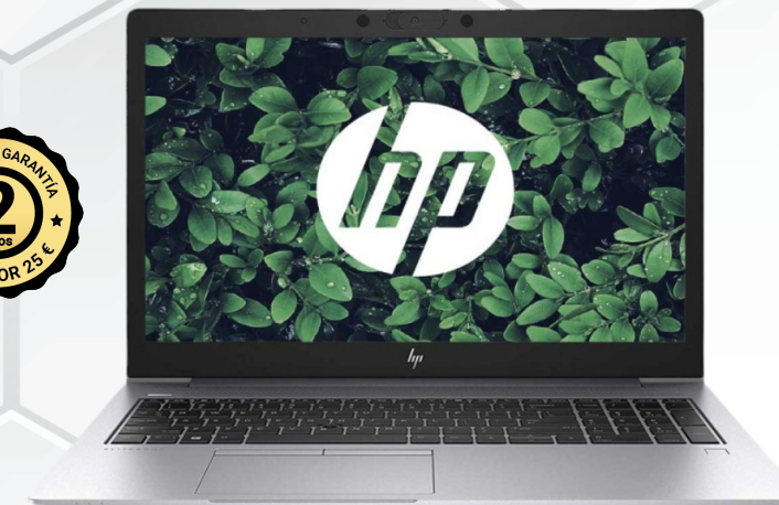
PORTÁTIL HP ELITEBOOK 830 G6 REACONDICIONADO REF.: OC-11704