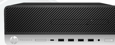
PC HP 600 G4 REACONDICIONADO REF.: OC-0746